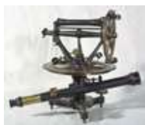
Museo "Michelangelo" riconoscimento regionale L. R. 12/2005

Centro AICA ECDL, ECDL CAD. Centro TRINITY